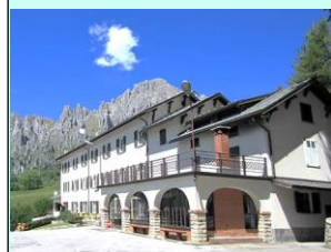
Pian dei Resinelli

dal 2 al 4 Novembre presso la casa "Montanina"