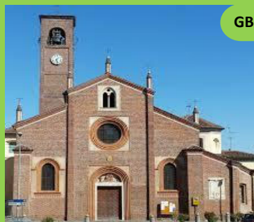
San Giovanni Battista