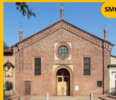
Santa Maria del Carmine