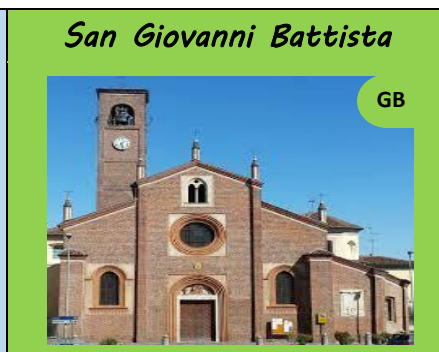
San Giovanni Battista