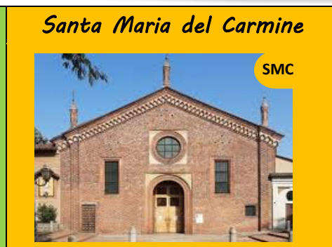
Santa Maria del Carmine