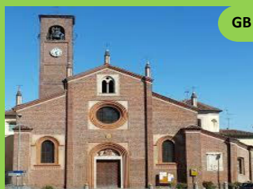
San Giovanni Battista