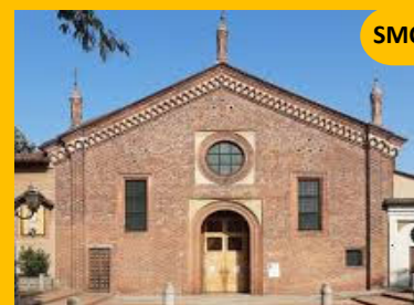
Santa Maria del Carmine