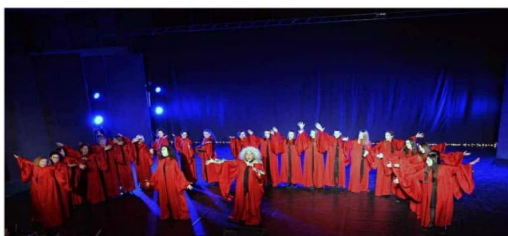
Ingresso a offerta libera. Il ricavato verrà devoluto alla Parrocchia.

Comunità Pastorale Dio Padre del Perdono Parrocchia S. Maria del Carmine