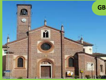
San Giovanni Battista