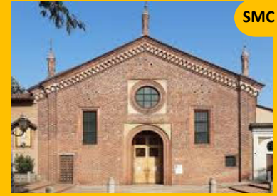
Santa Maria del Carmine